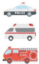
警察・救急・消防